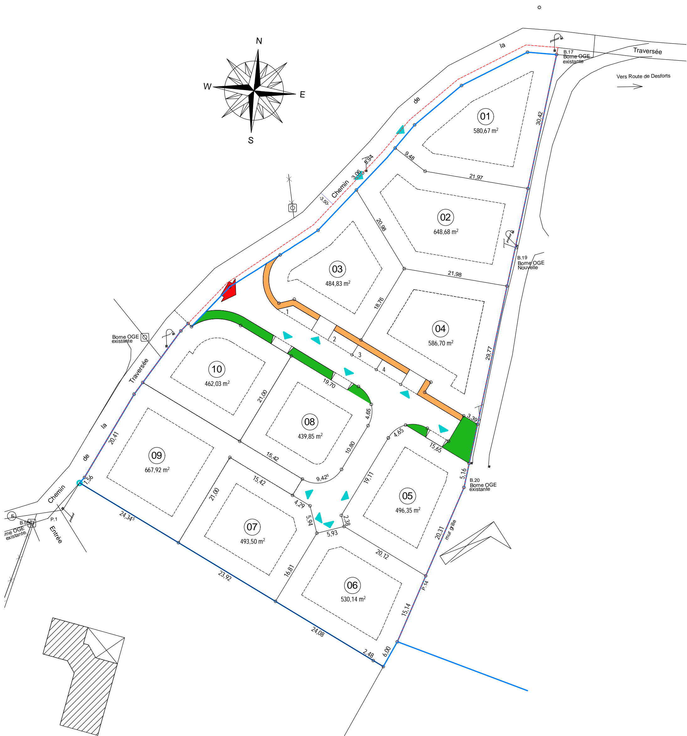
PLAN DE BORNAGE Echelle : 1/500e